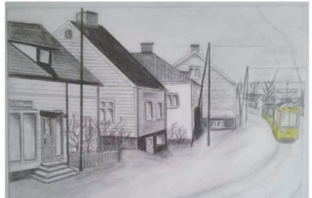
Kuvassa Tykkyläisen kampaamo 1940-luvulla