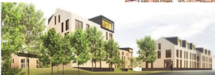
Havainnekuva Vanhalta Hämeentieltä / Schauman Arkkitehdit Oy