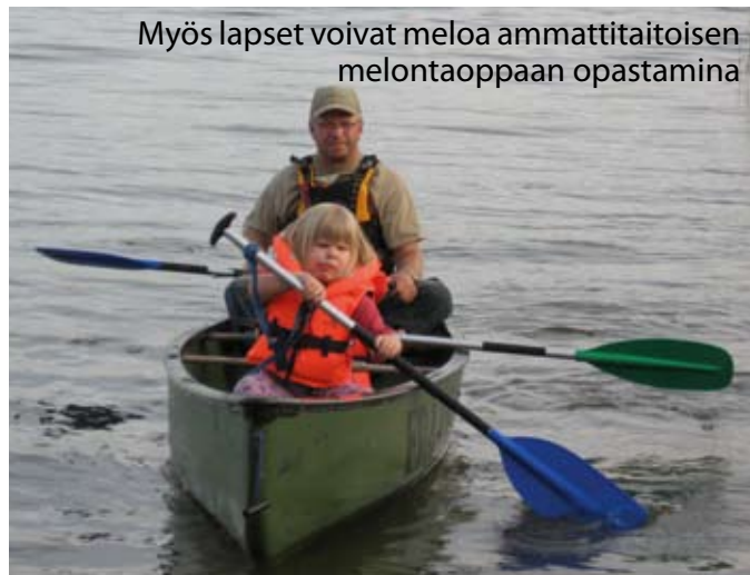
Myös lapset voivat meloa ammattitaitoisen melontaoppaan opastamina

Yhteystiedot: Jarmo Rakkolainen p. 044 309 8914 aquaticus@luukku.com www.jrerapalvelut.tk