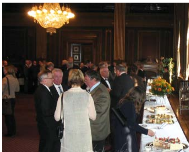
Suomen Omakotiliiton 60v juhlatilaisuus Säätytalolla.