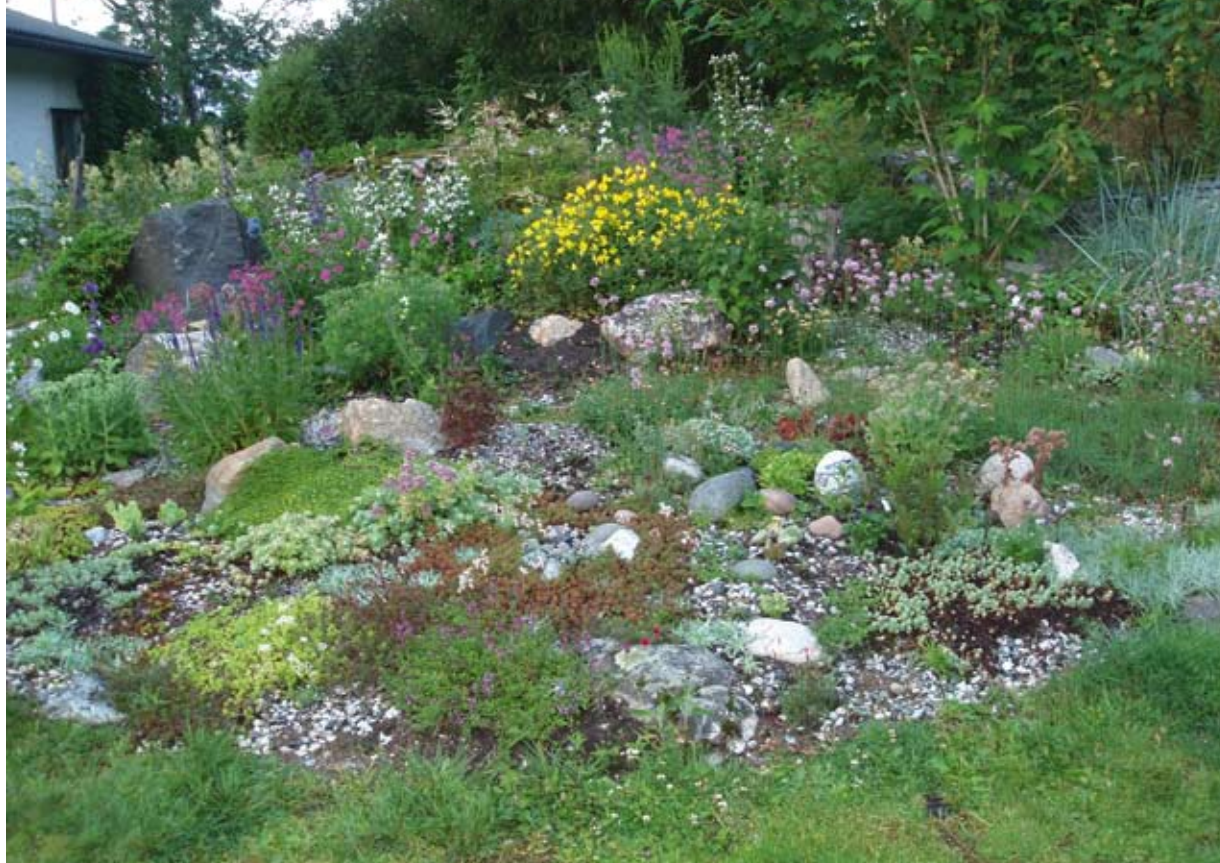
Näkymä kirjoittajan omalta pihalta.

tuhatta riippuen siitä, mitä taksonoja otetaan laskennan kriteereiksi. Mukana on jo paljon sellaisiakin harvinaisuuksia, joiden kasvattaminen vaatii erikoista tietoa ja taitoa. Kirjat ja muut tiedon lähteet ovat korvaamattomia tässä harrastuksessa. Yrityksen ja erehdyksenkin koulu on tehokas, mutta lukukausimaksu on todella korkea.