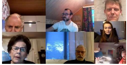
Kuva hallituksen kokouksesta 11.2.2021

Hieman pitkälle venyi syyskokouksen pitäminen, mutta ajatuksena oli syödä joulupuuroa porukalla kokouksen jälkeen, vaan kuinka kävikään... Puurojuhla peruttiin ja kokous pidettiin ensimmäistä kertaa ikinä etänä . Kaikki sujui kuitenkin hienosti, kun alkuun päästiin.