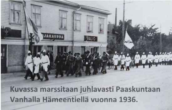
Kuvassa marssitaan juhlavasti Paaskuntaan Vanhalla Hämeentiellä vuonna 1936.

Kaarinan VPK täyttää vuonna 2024 125 vuotta. Sillä lienee selvä yhteys vanhojen valokuvien keräämiseen. — Kanna kortesi kecoon!