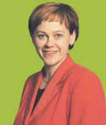
Paula Lehtomäki Ympäristöministeri

“Kestävä kehitys on mahdollista. Tuetaan sitä pienin, mutta merkittävien valinnoin joka päivä!”