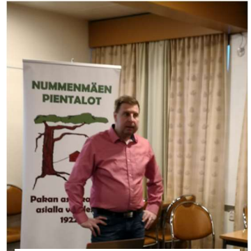
Tämä mies tiesi mistä puhui.

Panelisteina kaupungin virkamiehiä ja päättäjiä. Toivottavasti myös poliisi.