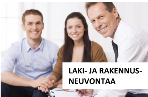
LAKI- JA RAKENUS- NEUVONTAA