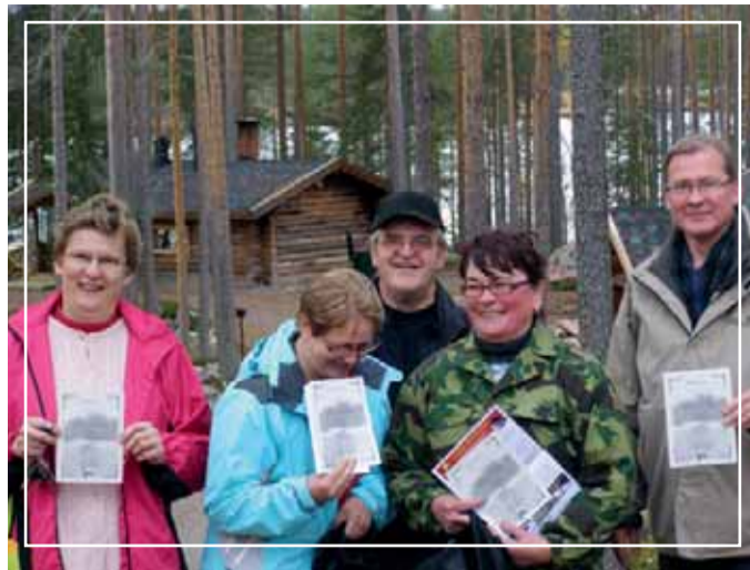
Ruunaa on kohdannut voittajansa

Omakotiliitto seuraa pientaloasumisen kehitystä ja puuttuu epäkohtiin. Omakotiliitto nostaa aktiivisesti yleiseen keskusteluun pientaloasukaiden kannalta tärkeitä asioita. Liitto vaikuttaa tekemällä aloitteita ja antamalla lausun-