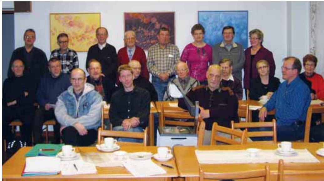
Syyskokouksen osallistujakuntaa yhteiskuvassa.

Kokoonnuimme syysvuosikokouksen merkeissä Timitran Linnassa 19.11.2008.