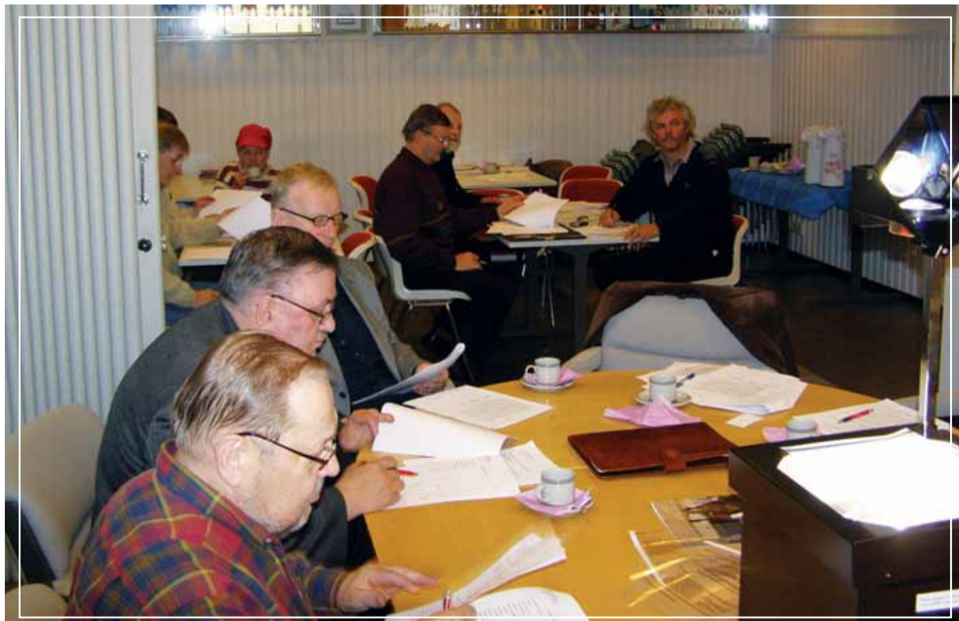
Kuva Piirijärjestön syysvuosikokouksesta PunaMusta Oy, Nurmeksken tiloissa 12.11.2008.