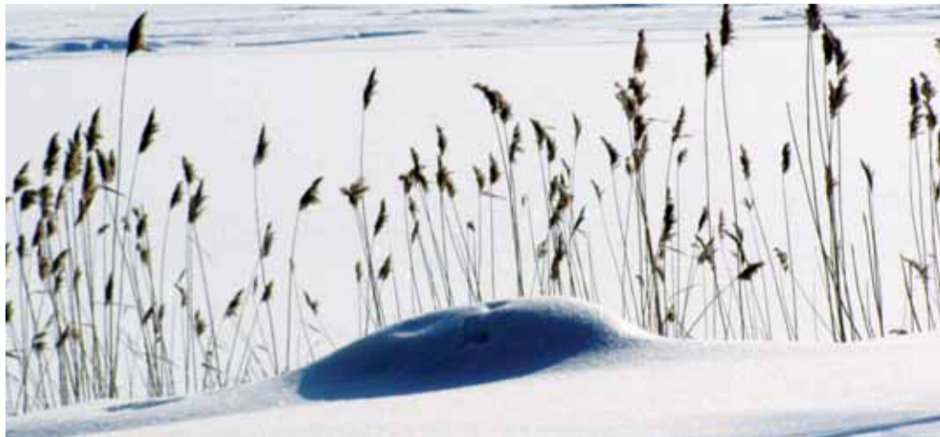
Valoa ja Varjoja.