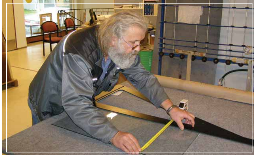
Uudet avarat tilat Pielisentie 47 mahdollistavat paremman asiakaspalvelun...

Niin luottamushenkilöille, kuin jäsenillekin toivon aktiivista osallistumista yhdistyksen toimintaan ja Lieksan paikallisten yritysten aktiivista hyödyntämistä.