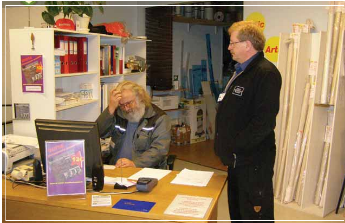
Ilkka palvelemaan Seppo Pesosta Lieksan Lukkosepiltä...