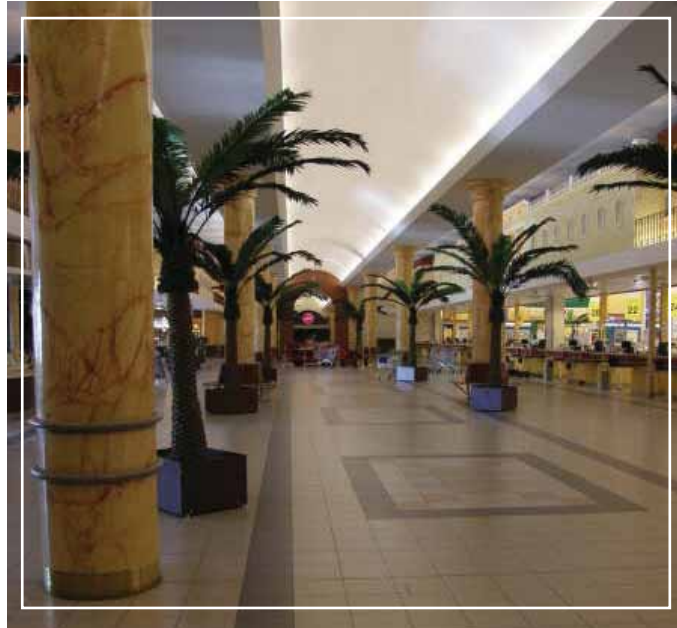
Keskisen Kyläkaupan ja hotellin aulatiloja...

Vihdoinkin koitti se kauan odotettu lauantai-aamu 19.07. jolloin pääsimme lähtemään asuntomessumatka. Lähtö oli klo 5.00 linja-autoasemalta ja iloinen yllätys oli, että kaikki matkalle ilmoittautuneet olivat hyvissä ajoin asemalla ja valmiina lähtöön. Pientä jännitystä oli ollut ilmassa, että miten käy sitten kun lähtöhetki koittaa, miten moni jää tulematta. Mutta onneksi kaikki tulivat kenen pitikin tulla, kiitos kaikille ilmoittautuneille siitä. Meitä oli yhteensä 52 ja kuljettaja.