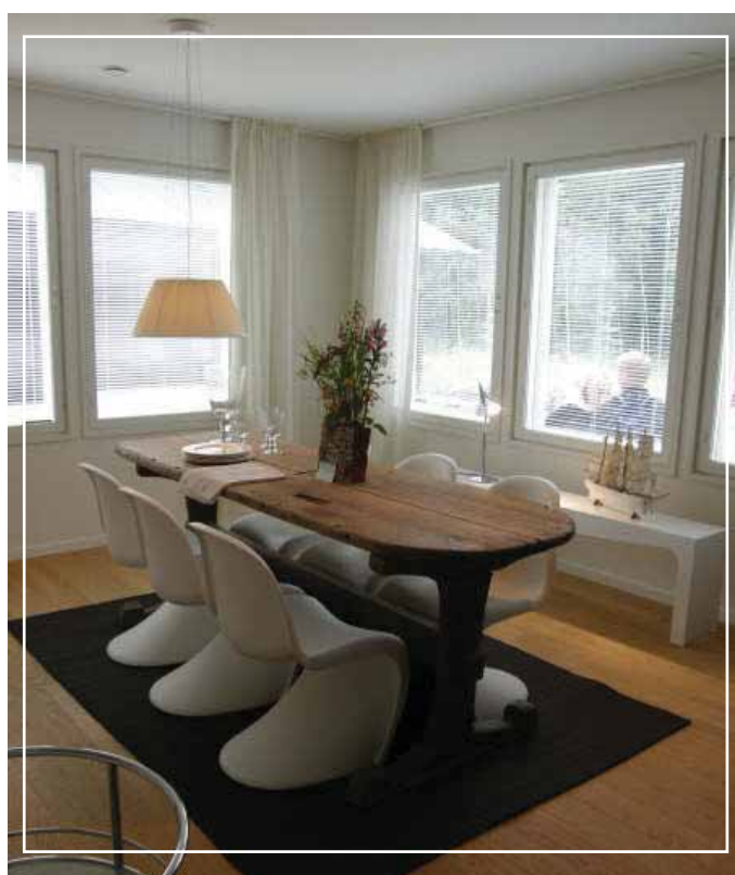
Tämän messutalon sisustuksesta löytyi vanhaa ja uutta...