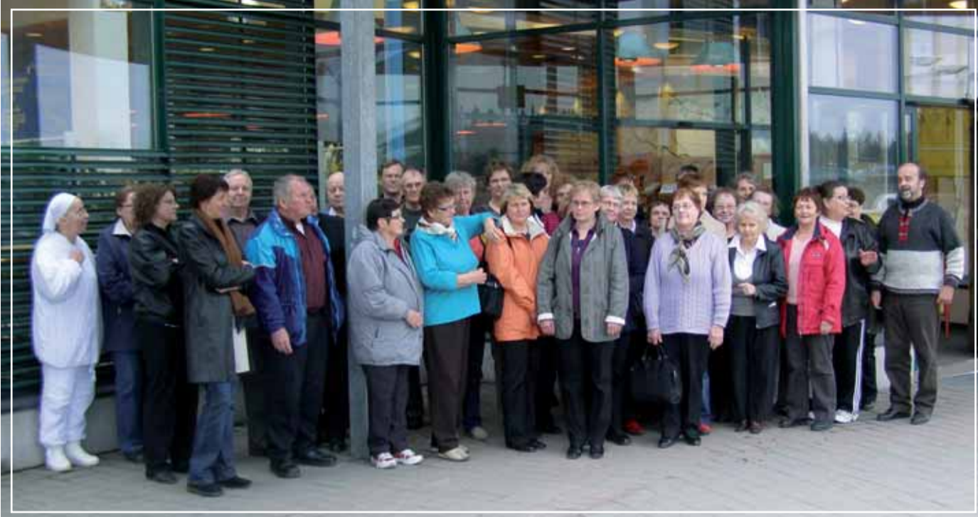
Iloiset messumatkalaiset koottuna yhteiskuvaan.