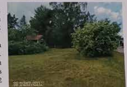
Jasmike puhkesi kukkaan 2022