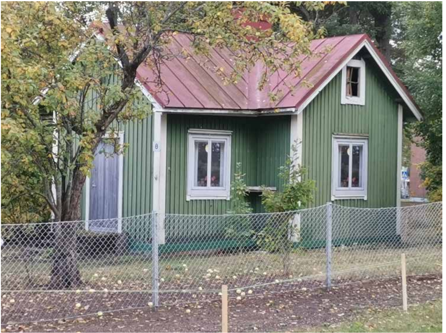
Vihreä Huvila kesän aherruksen jälkeen.