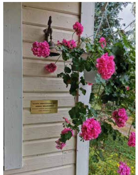
Vuoden Omakotiasukas -laatta Lehtolan tilan seinään kiinnitettynä