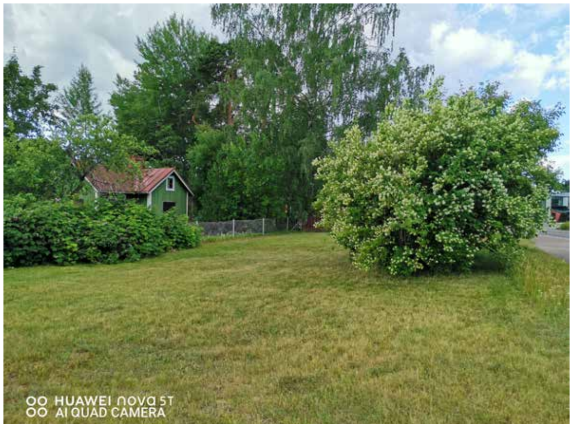
Jasmiini puhkesi kukkaan