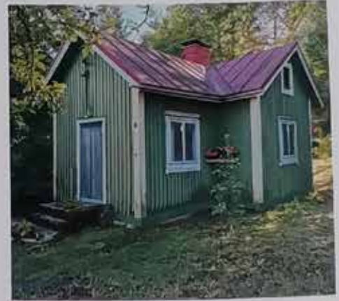
Nummelan keskustan vanhin asuintalo; Vihreä Huvila.

Vihdin Omakotiyhdistys ry on Suomen suurin Omakotiyhdistys, yli 4.100 jäsentaloutta, yli 13.000 henkilöä jäsenyyden piirissä