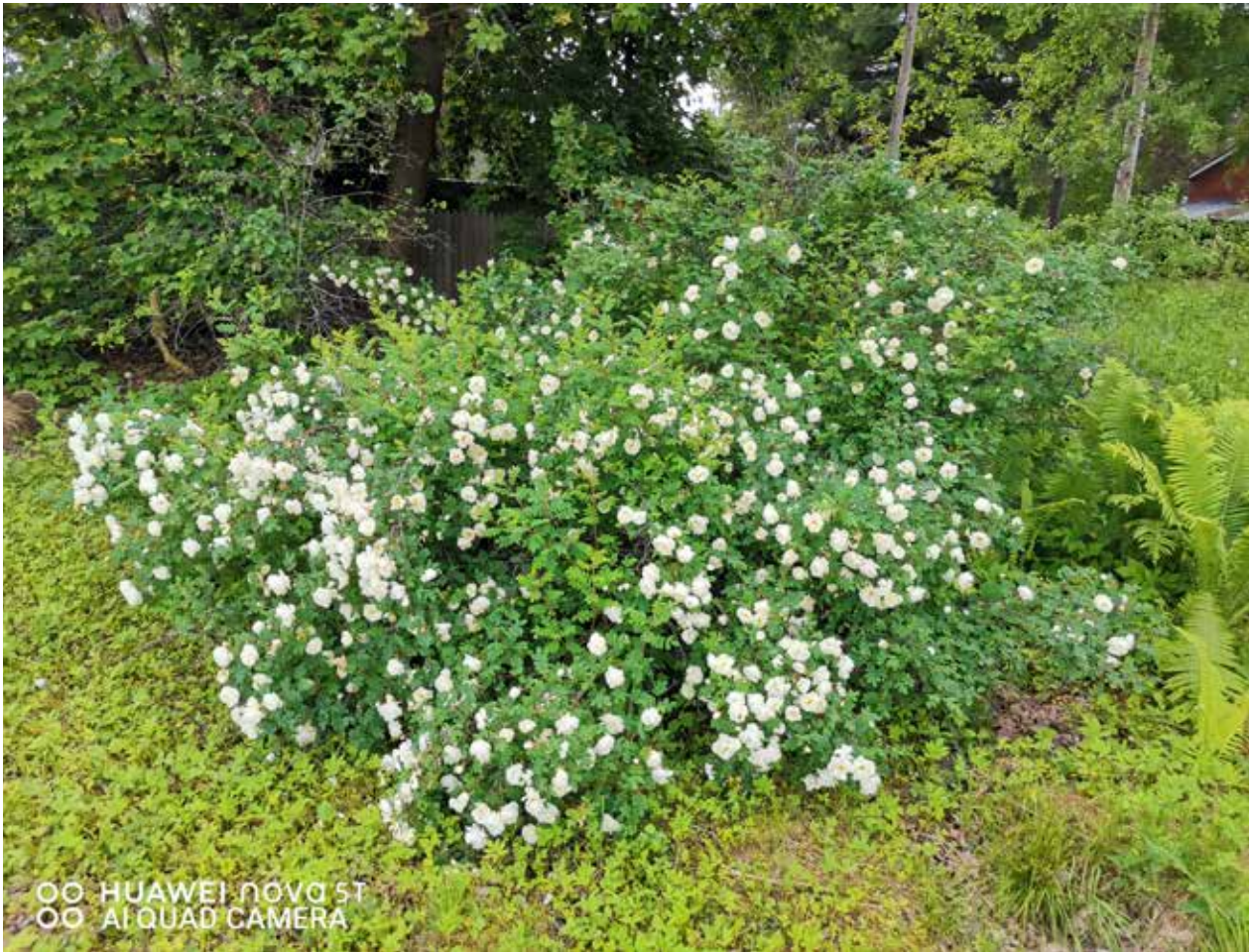
Juhannus- ruusut kukkiivat Vihreän Huvilan tontilla