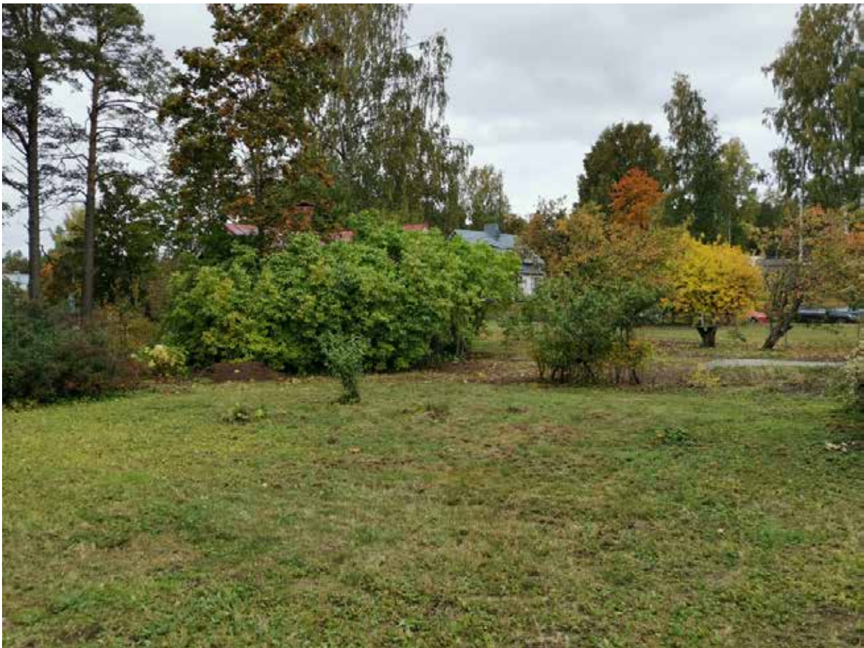
Vihreän Huvilan Omakoti- torin nurmikko ajettu kuudennen kerran ennen 17.8.2022 torita- pahtumaa