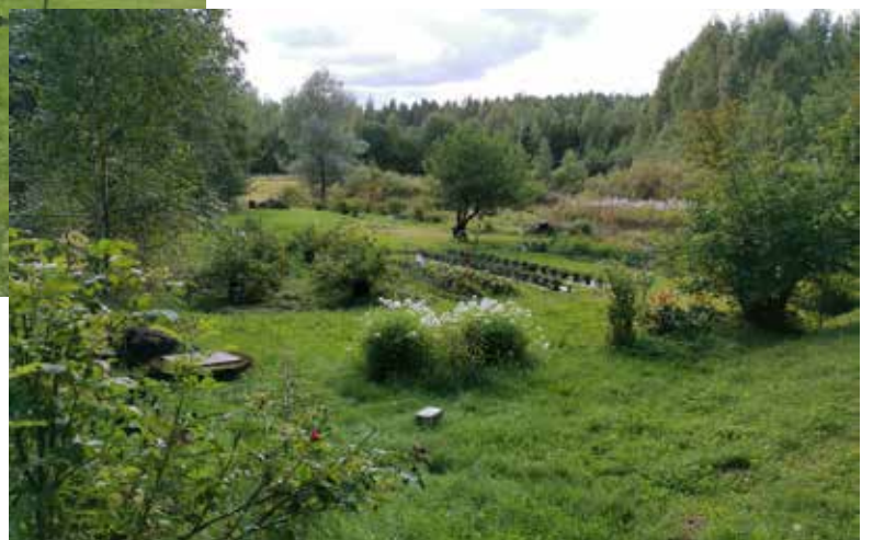
Suurempi kasvimaan kukkineen ja hedelmäpuineen löytyy alapellolta