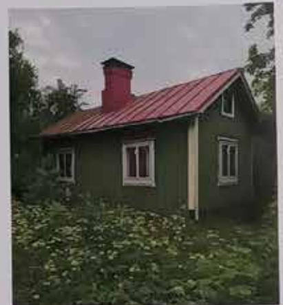
Vihreä Huvila taka 2022