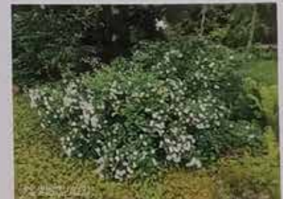
Juhannusruusut kukkivat 2022