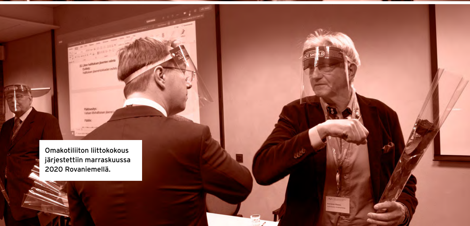
Omakotiliiton liittokokous järjestettiin marraskuussa 2020 Rovaniemellä.